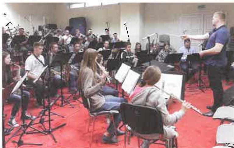
Nagranie płyty w sali orkiestry PAK KWB Konin

Sompoleńska Orkiestra aktywnie uczestniczy w wielu imprezach kulturalnych, m. in. wyjeżdża na spotkania orkiestr dętych do Pity, Wrześni, Kramska, Wierzbinka i Kleczewa. W 2006 i 2007 roku orkiestra otrzymała wyróżnienie na Przeglądzie Orkiestr Dętych w Kleczewie oraz Puchar Wójta Wierzbinka na Biesiadzie Orkiestr we Wierzbinku. W 2008 roku zdobyła Statuetkę Starosty Konińskiego podczas Impresji Muzycznych w Rychwale, w 2010 roku Statuetkę Starosty Konińskiego podczas VII Pikniku Orkiestr Dętych w Rychwale i Puchar Starosty Wrzesińskiego w czasie III Impresji Muzycznych Orkiestr Dętych we Wrześni.