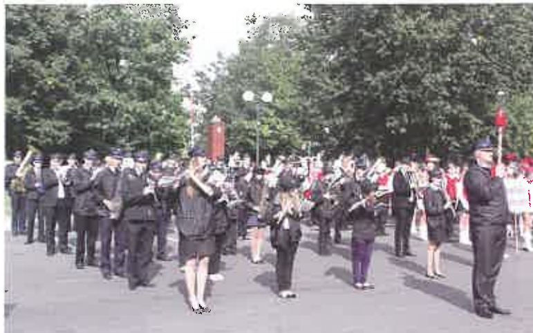
Festiwal Orkiestr Dętych we Wrześni

Operą Kameralną, Filharmonią Koszalińską, Piłską Orkiestrą Kameralną, Berlin Baroque Trumpet Ensemble. Obecnie jest pierwszym trębaczem orkiestry Teatru Wielkiego w Poznaniu.