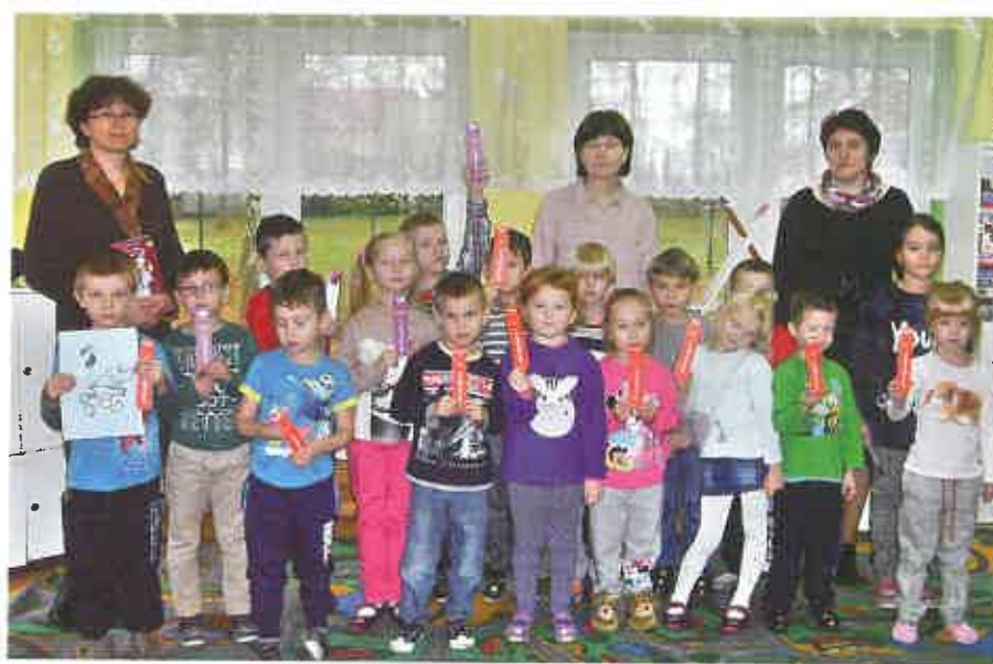
Akcja „Czytam sobie”

Grudzień to znakomity miesiąc na podsumowanie całego roku działalności bibliotek gminy Sompolno oraz weryfikację aktywności bibliotekarzy i czytelników. Miejsko-Gminna Biblioteka Publiczna w Sompolnie i jej filie w Lubstowie i Mąkolnie przez cały miniony rok tętniły gwarem dzieci, młodzieży oraz starszych czytelników. W tym czasie odbyło się kilkanaście lekcji bibliotecznych, zrealizowano ponad 100 spotkań z dziećmi i młodzieżą, 16 wystaw, 7 konkursów literackich, 2 kiermasze książek, zorganizowano 3 spotkania autorskie, występ teatryku krakowskiego oraz inne imprezy, w których wzięło udział 9 000 mieszkańców gminy. Działo się naprawdę dużo. Nie zabrakło też okazji do spotkań, zarówno dużych wydarzeń literackich, jak i małych spotkań warsztatowych z poezją i malarstwem.