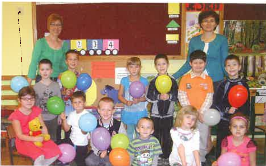
Urodziny Kubusia Puchatka

Zapraszamy wszystkich mieszkańców naszej gminy na kolejny rok pełen nowinek, wydarzeń, spotkań, informacji ze świata bibliotecznego, konkursów i innych atrakcyjnych niespodzianek. Przypominamy, że w 2015 roku przypada 70. rocznica powstania Biblioteki w Sompolnie. Informacje o nas dostępne są na naszej stronie: www.sompolno.naszabiblioteka.com . Zapraszamy również do współpracy z Zespołem Cyfrowego Archiwum Tradycji Lokalnej Fundacji Ośrodka KARTA, którego