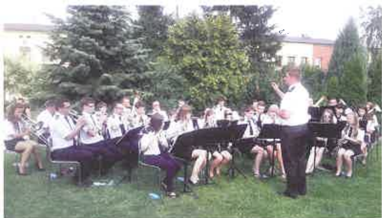
Letni koncert na rynku w Sompolnie

Sompoleńska Orkiestra aktywnie uczestniczy w wielu imprezach kulturalnych, m. in. wyjeżdża na spotkania orkiestr dętych do Pity, Wrześni, Kramska, Wierzbinka i Kleczewa. W 2006 i 2007 roku orkiestra otrzymała wyróżnienie na Przeglądzie Orkiestr Dętych w Kleczewie oraz Puchar Wójta Wierzbinka na Biesiadzie Orkiestr we Wierzbinku. W 2008 roku zdobyła Statuetkę Starosty Konińskiego podczas Impresji Muzycznych w Rychwale, w 2010 roku Statuetkę Starosty Konińskiego podczas VII Pikniku Orkiestr Dętych w Rychwale i Puchar Starosty Wrzesińskiego w czasie III Impresji Muzycznych Orkiestr Dętych we Wrześni.