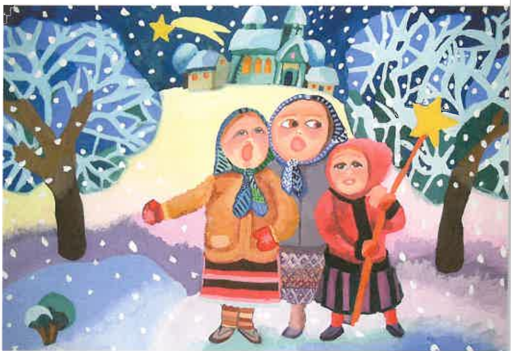
Praca Sandry Wiśniewskiej

Na XVIII Wielkopolskim Konkursie Plastycznym na Najpiękniejszą Kartkę Bożonarodzeniową w Pleszewie wyróżnienie otrzymała Oliwia Kaczmarek.