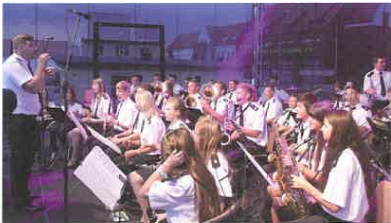
Festiwal Orkiestr Dętych w Słupcy

Efekty pracy kapelmistrza oraz muzyków zostały dostrzeżone i docenione w 2014 roku. Orkiestra zdobyła 2. miejsce za wykonanie muzyki koncertowej na II Ogólnopolskim Festiwalu Orkiestr Dętych w Kłomnicach, 1. miejsce za wykonanie muzyki koncertowej oraz 3. miejsce za przemarsz na XXIV Regionalnym Przeglądzie Amatorskich Orkiestr Dętych w Kleczewie.